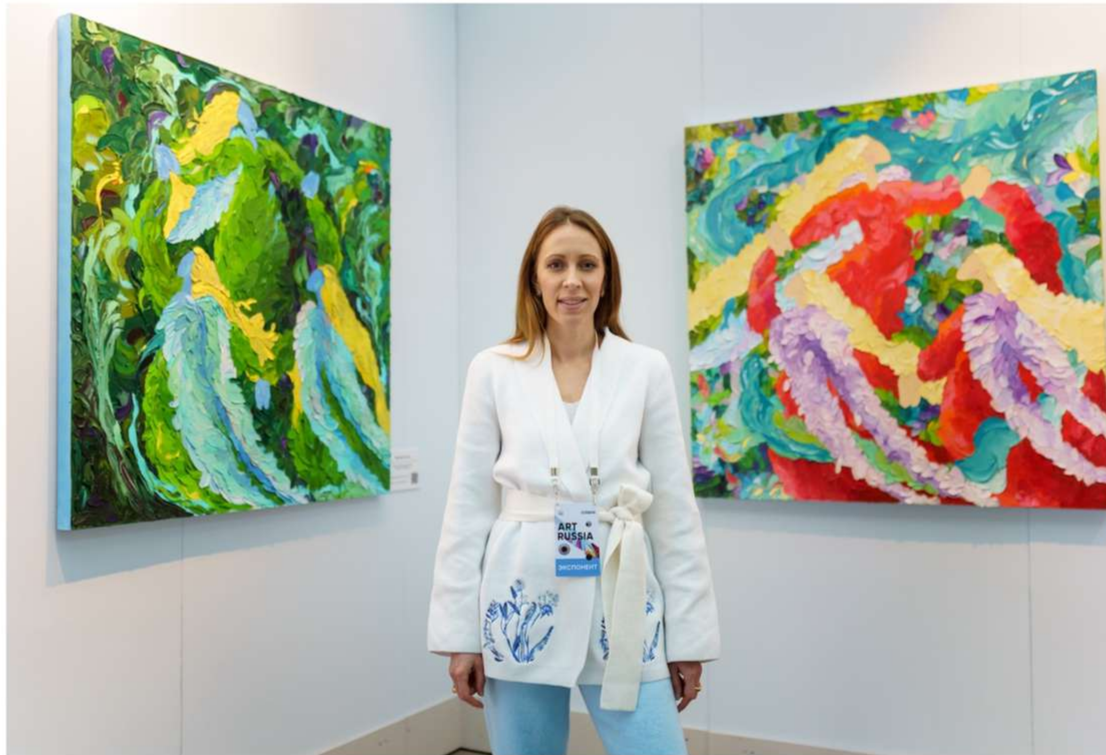
Art Russia Fair, Москва. 2021, 2022

ART SUMMER Новая Третьяковская Галерея, МОСКВА, 2021