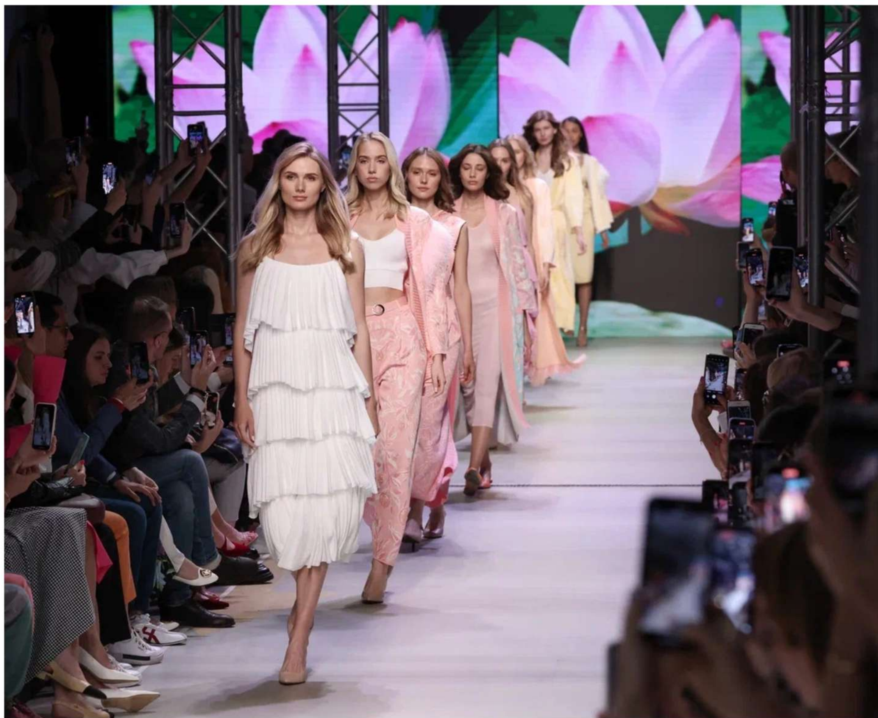
Московская неделя моды при поддержке мэра города Собянина 2022 в парке Зарядье