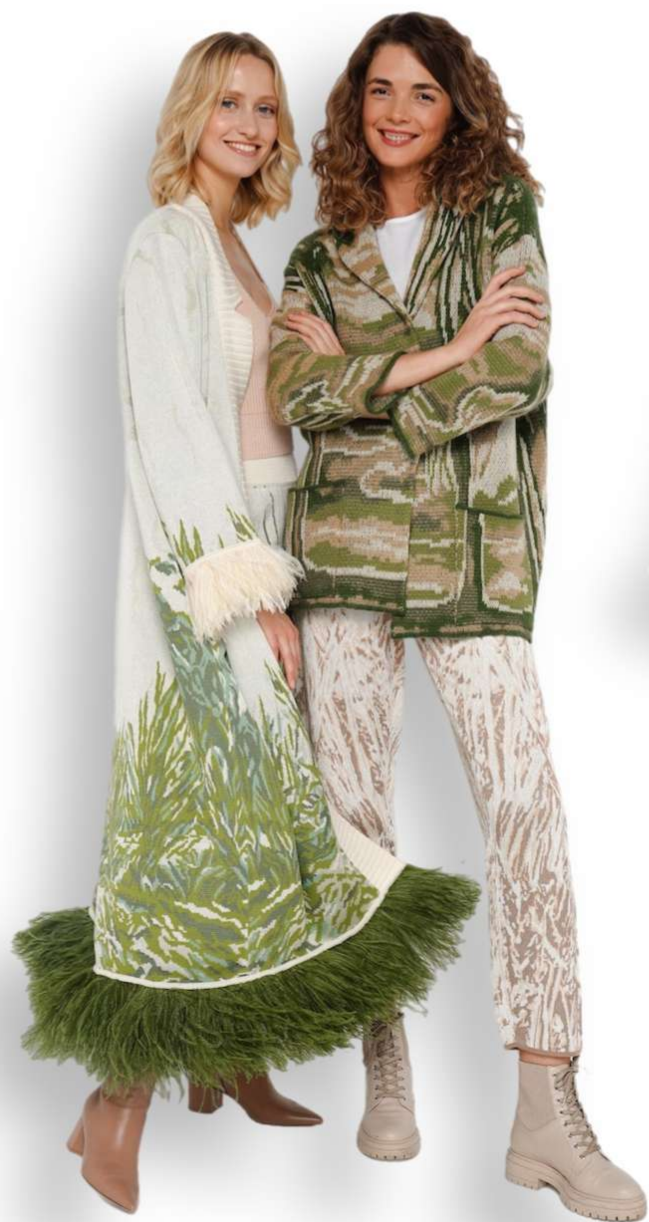
Кардиган «Плодородие» с декором