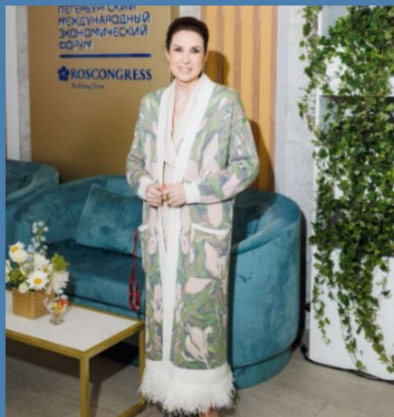
Юлия Рублева - политик, меценат, общественный деятель