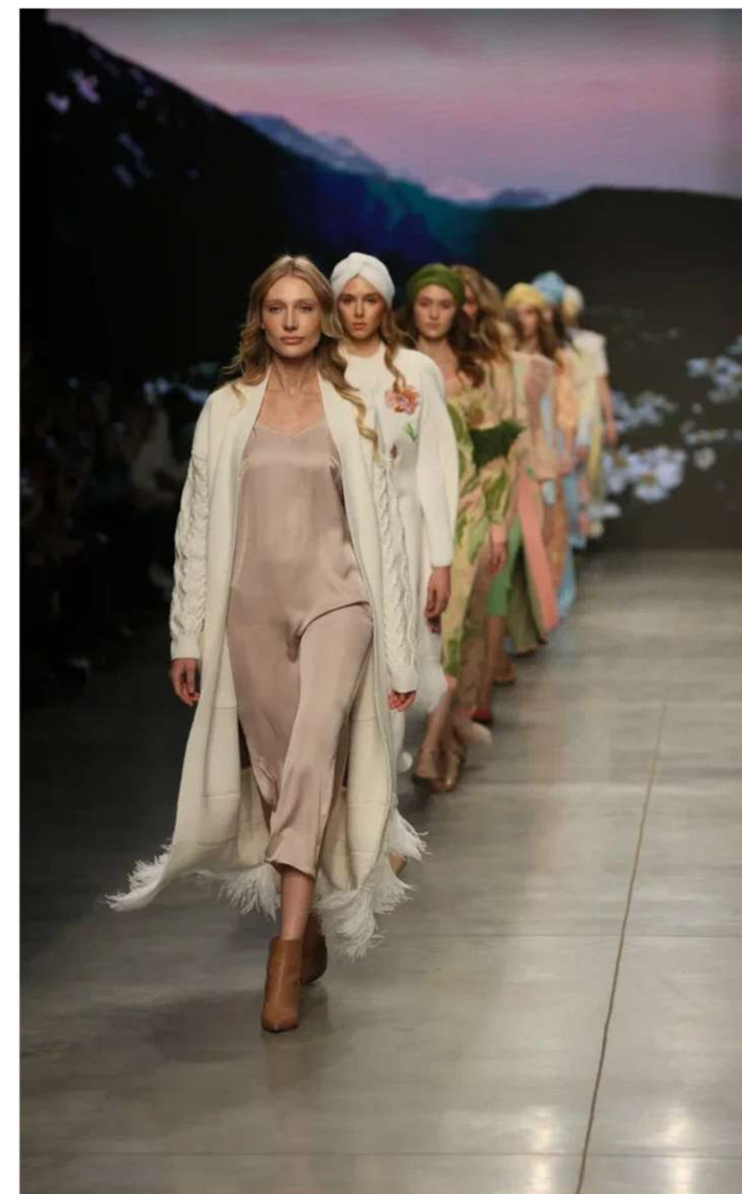
Mercedes-Benz Fashion Week 2020, 2021