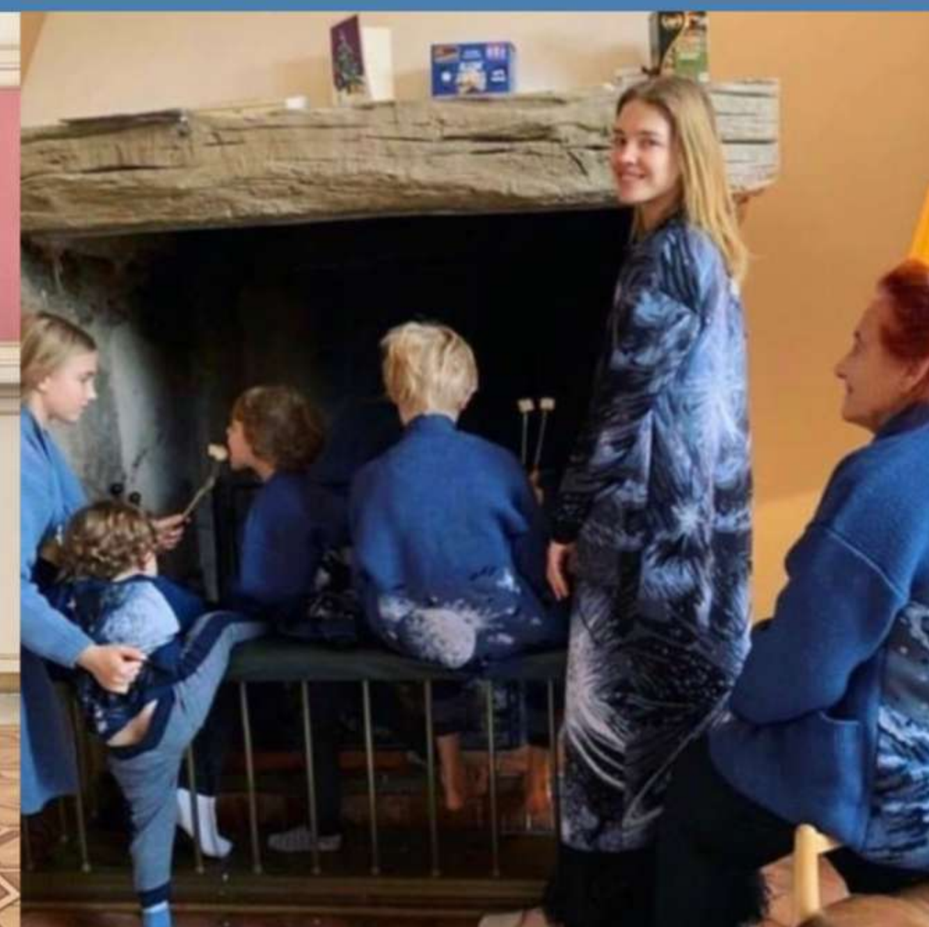
Наталья Водянова - российская супермодель