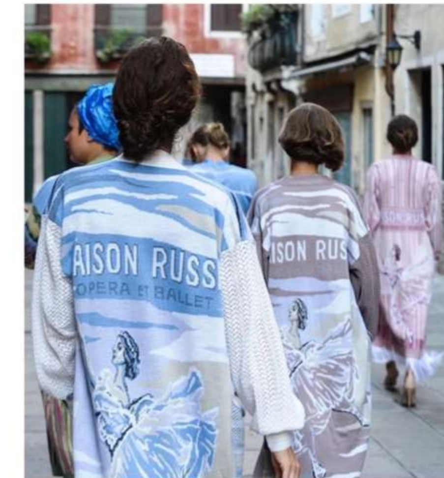
Maison Kaleidoscope весна-лето 2018